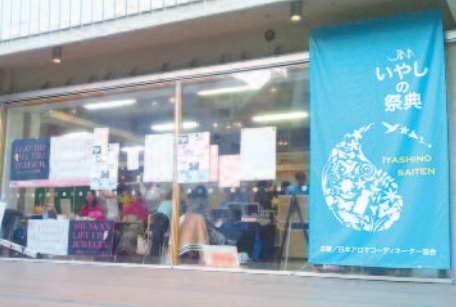
会場 3331Arts chiyoda 廃校利用。オープン感覚でとても素敵でした！当日は長蛇の列！