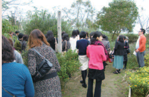
広大な敷地の様々なハーブが私たちの心と身体を癒してくれました。