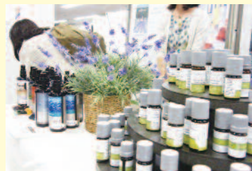
様々な商品がイベント価格にて並びました!