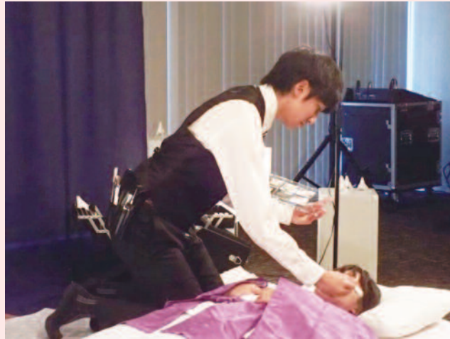
納棺の儀 所作にそれぞれの思いを胸に見入る