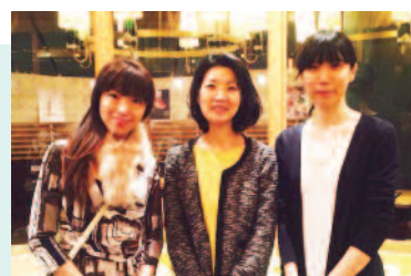
プロジェクトメンバーです。力を合わせて 楽しみながら運営させて頂きました