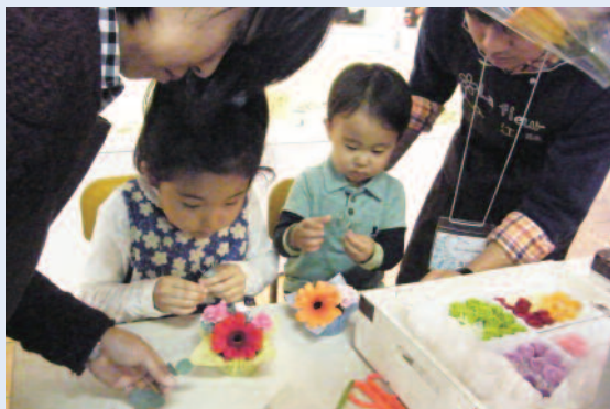
体験コーナーではかわいい子供たちも真剣