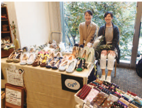
復興支援ブース (石巻市より布サンダル)