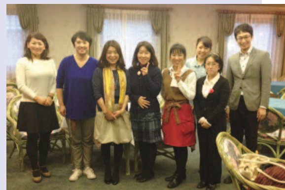
参加スタッフ全員でハイチーズ ^^