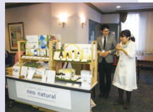
地元名古屋の自社農場で採れる化粧品。