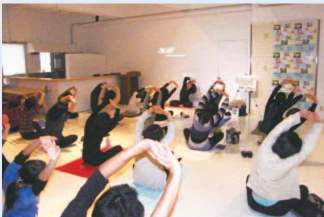
ヨガ&実践心理学セミナー 身体と心と両面で