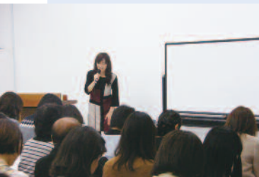
月星座のセミナー 癒されました