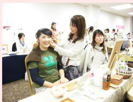
気さくな原さんブース体験