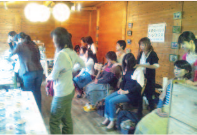
お買い物とトリートメントでリフレッシュ