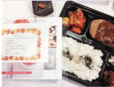
大豆を中心としたハンバーグや ガトーショコラ凄いです!