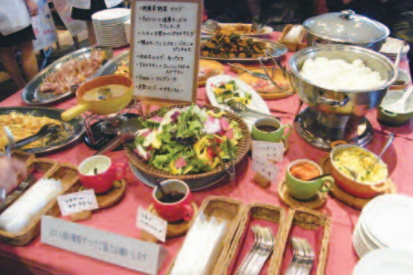
818 話題の新鮮フルーツと野菜のランチ ビュッフェ。誰もが美味しいと絶賛！