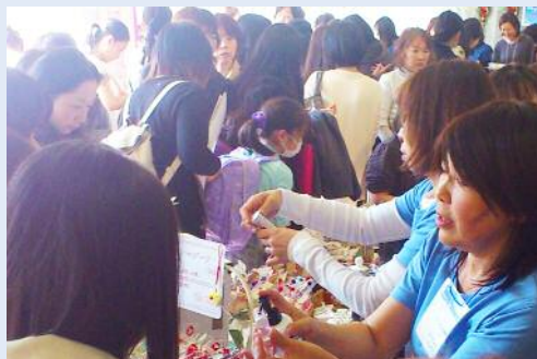
会場内は終日大盛況で、冬なのに暑いくらい