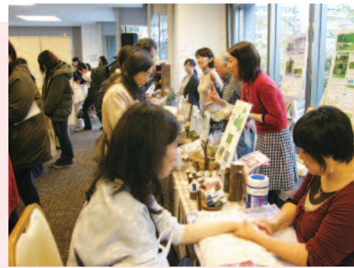
開場と同時に大賑わい!