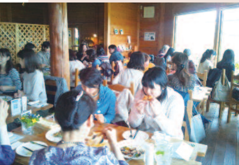
ピアノの音を聞きながらハーブのコース料理で歓談♪