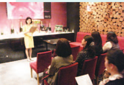
無料で様々なジャンルの講師のお話 が聴け、大盛況