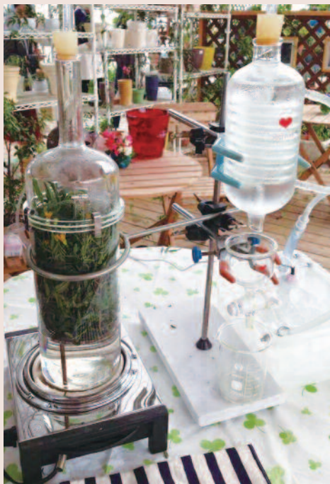
別棟のガーデンハウスでは蒸溜実演見学も