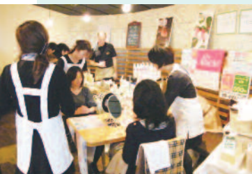
様々な体験や販売ブースで賑わ い、来場者も出店者も笑顔溢れ る一日でした