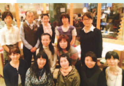
ボランティアスタッフの皆様さん。温かい笑顔 で来場者の心とカラダをほぐして下さいました