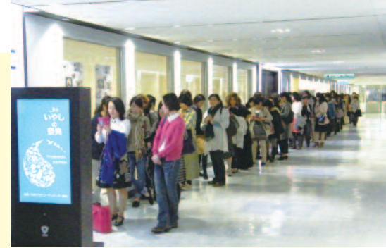
開場前。200名以上の行列ができました!