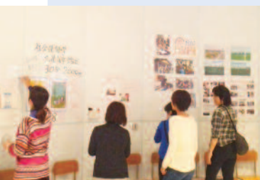
ラウンジルームでの掲示版