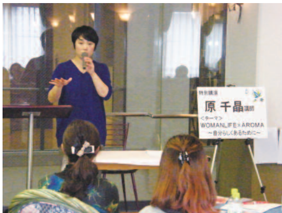
原さんの心こもる講演