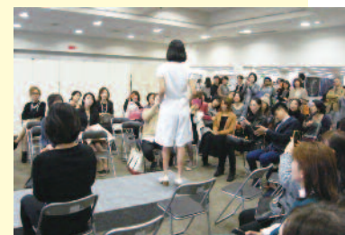
大阪モード学園学生によるセラピストウエアコンテスト。ショーが最終決戦!