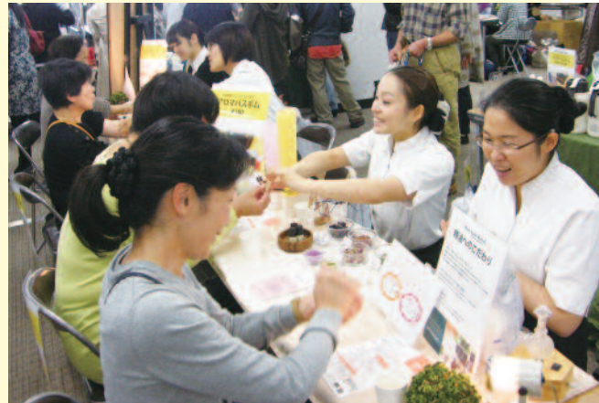
大阪ならではの企画「朝市」でオープン時から大盛況! 40ブース全てが大賑わい