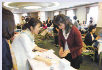
ピンゴ大会ではネオナチュラルさんより 賞品授与