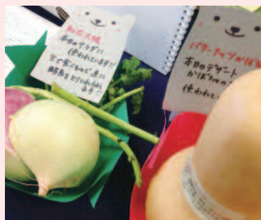
地元の特産物も販売や食材に