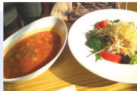
産直野菜 50 食限定ランチ即売！！