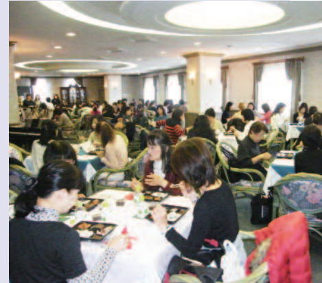
満席御礼! マクロビランチに舌鼓