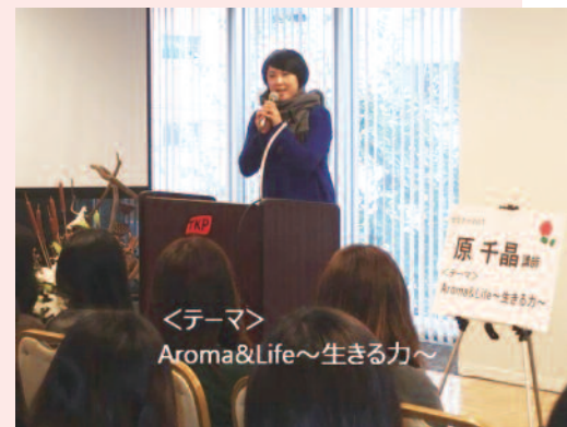
心伝わる講演に感動の涙も