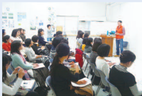
アロマと記憶のお話。展開が面白い！