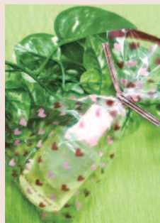
お土産のハーブウォーター