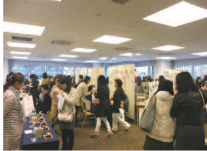
様々なブースが予約でいっぱい