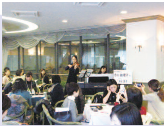
心に響く音色♪癒されます