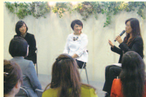
原氏、福森氏、酒居先生によるトークセッション。勇気と元気を頂きました